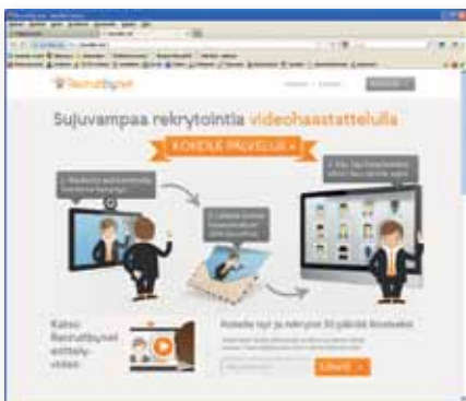
Recruitby.net on rekrytoinnin verkkopohjainen apuväline.

Koulutuskumppanuuden kehittämistä jatkettiin yhteistyössä Amiedun kanssa. Toteutuneiden koulutuspäivien määrä kasvoi 25 prosenttia ja koulutukseen osallistuneiden määrä 38 prosenttia edellisestä vuodesta.