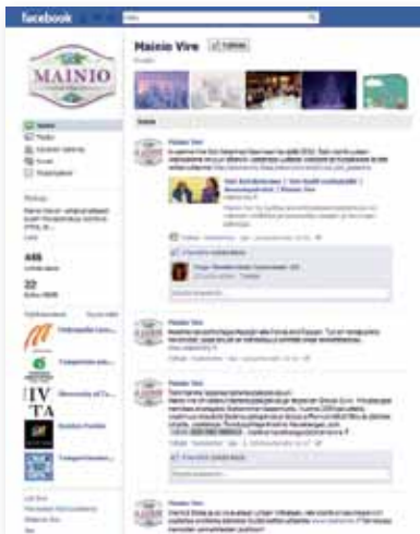
Sosiaalisen median käyttö on edelleen kasvamassa.

Mainio Vireen toimintajärjestelmä perustuu ISO 9001:2008 laatujärjestelmään. Sen malleja noudattamalla ja yrityksen toimintatapoja jatkuvasti kehittäen ja tehostaen pyritään varmistamaan niin asiakkaiden kuin työntekijöiden hyvinvointi ja tyytyväisyys.