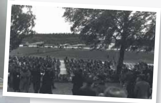
Avajaiset vuonna 1935